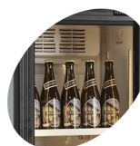
LED-lys i dørramme